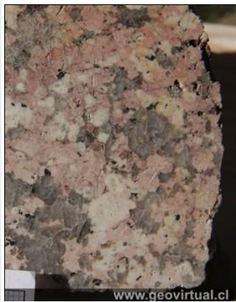
Roca intrusiva - el granito