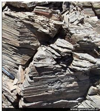
Esquisto: Una roca metamórfica