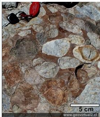
Conglomerado - una roca sedimentaria