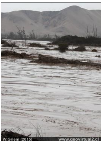
Río Copiapó en el desierto de

Tópicos de la sedimentología: Meteorización Erosión Transporte Deposición Estratificación Petrografía de los sedimentos