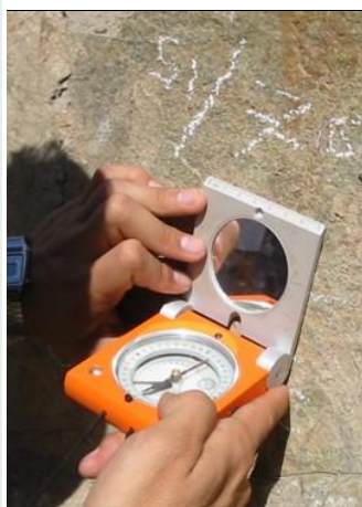
Uso de la brújula Freiberger en terreno

Véase uso del Brunton: Americano (normal) rápido Americano (normal) detallado Notación círculo completo para Brunton