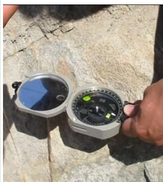
Uso de la brújula Brunton - medición del rumbo

Foto arriba izquierda: Escala del manto A= placa para medir; B = línea de lectura; C= sector rojo