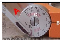
Foto arriba izquierda: Escala del manto A= placa para medir; B = línea de lectura; C= sector rojo