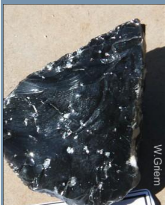
Ejemplo: Obsidiana (vidrio volcánico) - hialino