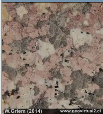
W.Griem (2014) www.geovirtual2.cl Granito Véase Museo Virtual