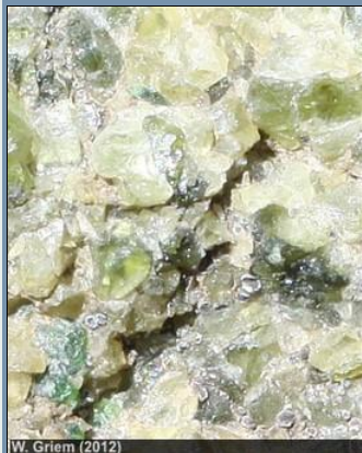
W. Griem (2012)

Las fábricas de cúmulo están realizadas principalmente en los cuerpos plutónicos máficos y ultramáficos y se las llaman 'layered intrusions' o es decir intrusiones estratificadas. La 'layered intrusion' la más grande es el complejo de Bushveld, África del Sur y es un cuerpo magmático de 450 x 350km de 9 km de espesor, compuesto de estratos de peridotita, piroxenita, gabro, norita y anortosita. En su parte inferior se sitúan 15 bandas de cromita de espesores hasta 1m suprayacentes por 25 bandas de magnetita. Otros cúmulos son la intrusión de Skaergard en Groenlandia y el complejo de Stillwater en Montana, EE.UU.