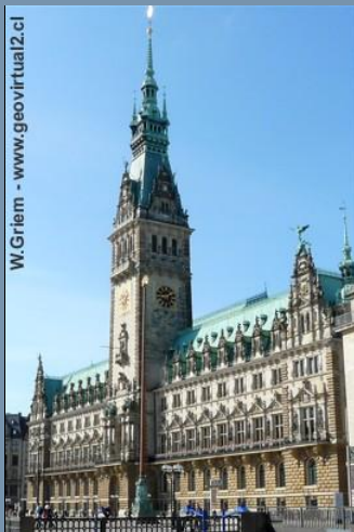
Techo de planchas de cobre oxidado en la alcaldía de Hamburgo (Alemania)