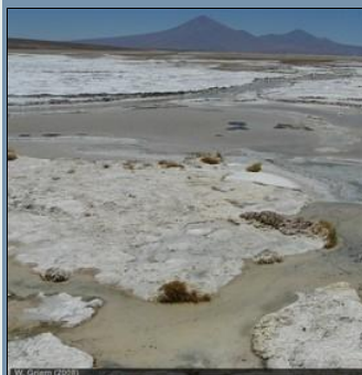
Arena - Foto arena