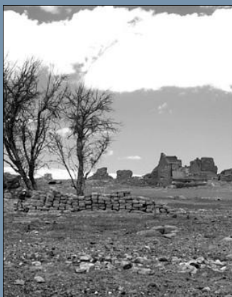
Ruina de una salitrera en Taltal, Chile: Salitre era uno de los no-metálicos más conocidos y más importantes del último siglo. Los nitratos eran importante para la fabrica de explosivos y fertilizantes. Intro salitreras de Taltal, Chile

Fuente: CIULLO, P. (1996): Industrial Minerals and their uses; a handbook and formulary. 632 páginas; New Jersey. y otros