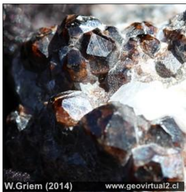
Mineral Granate, un nesosilicato.