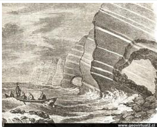
Erosión marina en Alemania, de Burmeister, 1851 - véase más y en grande