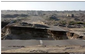
Erosión en el desierto de Atacama, Chile. - Véase en grande y más

La meteorización: Erosión / agua: deposición - erosión